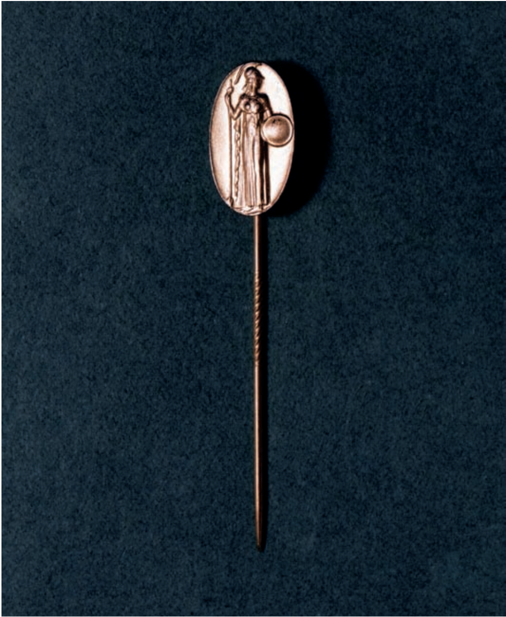
Mitgliedernadel der Max-Planck-Gesellschaft